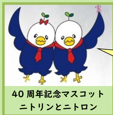
40 周年記念マスコット ニトリンとニトロン